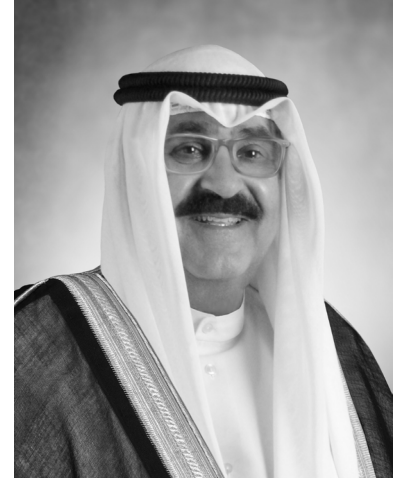
سمو الشيخ مشعل أحمد الجابر الصباح ولي عهد دولة الكويت