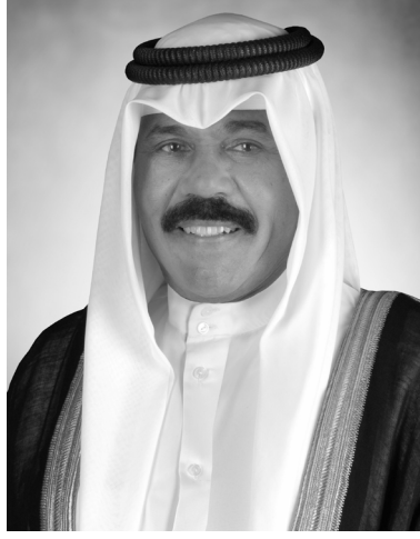
صاحب السمو الشيخ نواف أحمد الجابر الصباح أمير دولة الكويت