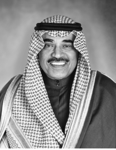
سمو الشيخ صباح الخالد الحمد الصباح رئيس مجلس الوزراء دولة الكويت