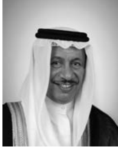
سمو الشيخ جابر المبارك الحمد الصباح رئيس مجلس الوزراء - دولة الكويت