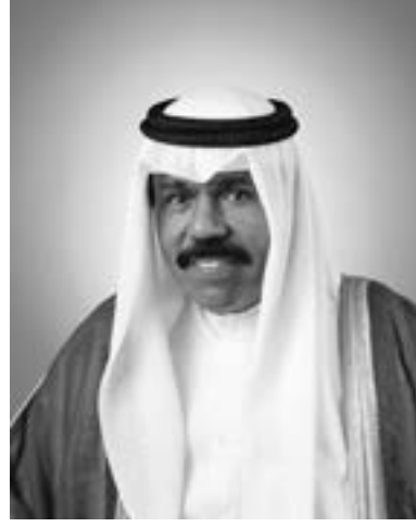
سمو الشيخ نواف الأحمد الجابر الصباح ولي عهد دولة الكويت