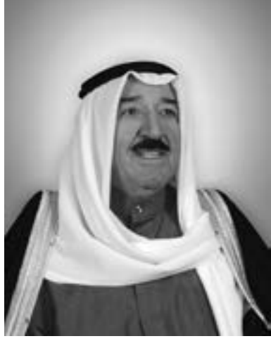
صاحب السمو الشيخ صباح الأحمد الجابر الصباح أمير دولة الكويت